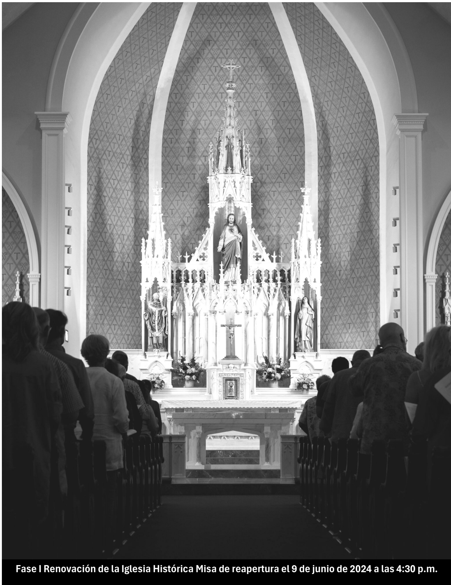
Fase I Renovación de la Iglesia Histórica Misa de reapertura el 9 de junio de 2024 a las 4:30 p.m.