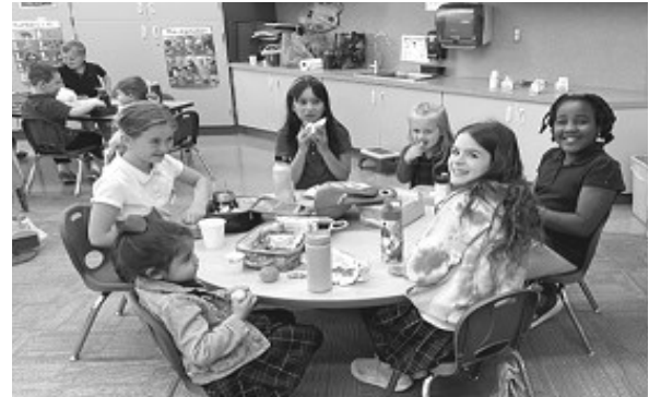
Compañeros de Almuerzo de Preescolar de 3er Grado

Únase a nosotros para "Canciones de Mariajuana," nuestro Concierto de Primavera el Jueves, 16 de Mayo a las 6:30 p.m.